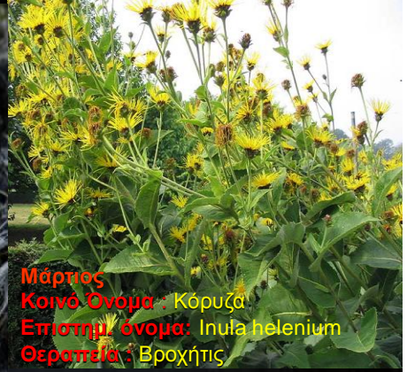
Μάρτιος Κοινό Όνομα: Κόρυζα Επιστημ. όνομα: Inula helenium Θεραπεία: Βρογχίτις