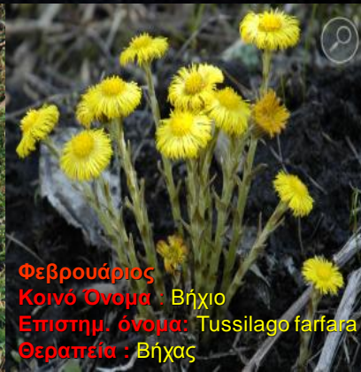
Φεβρουάριος Κοινό Όνομα: Βήχιο Επιστημ. όνομα: Tussilago farfara Θεραπεία: Βήχας