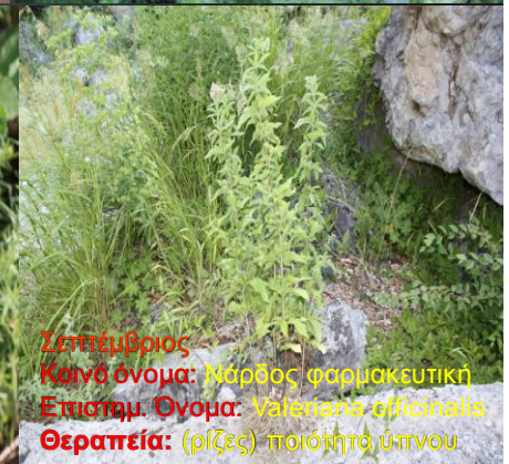
Σεπτέμβριος Κοινό όνομα: Μάρδος φαρμακευτική Επιστημ. Όνομα: Valeriana officinalis Θεραπεία: (ρίζες) ποιότητα ύπνου