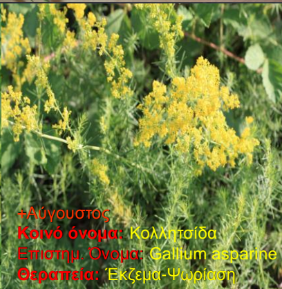
+Αύγουστος Κοινό όνομα: Κολλητσίδα Επιστημ. Όνομα: Gallium asperum Θεραπεία: Έκζεμα-Ψωρίαση