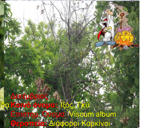
Δεκέμβριος Κοινό όνομα: Ίξος, Τκύ Επιστημ. Όνομα: Viscum album Θεραπεία: Διάφοροι Καρκίνοι