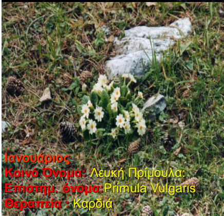
Ιανουάριος Κοινό Όνομα: Λευκή Πριμούλα Επιστημ. όνομα: Primula vulgaris Θεραπεία: Καρδιά