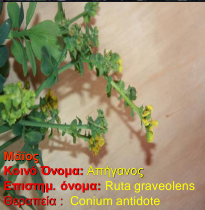
Μάιος Κοινό Όνομα: Απήγανος Επιστημ. όνομα: Ruta graveolens Θεραπεία: Conium antidote