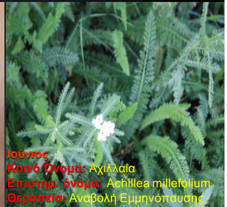
Ιούνιος Κοινό Όνομα: Αχιλλαία Επιστημ. όνομα: Achillea millefolium Θεραπεία: Αναβολή Εμμηνόπαυσης