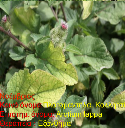
Νοέμβριος Κοινό όνομα: Πλατομαντήλα, Κολλητσίδα Επιστημ. όνομα: Atractium lappa Θεραπεία: Εξάνθημα