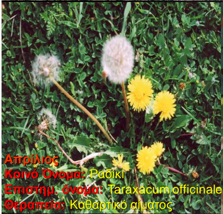
Απρίλιος Κοινό Όνομα: Ραδίκι Επιστημ. όνομα: Taraxacum officinale Θεραπεία: Καθαρτικό αίματος