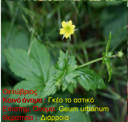
Οκτώβριος Κοινό όνομα: Γκέο το αστικό Επιστημ. Όνομα: Geum urbanum Θεραπεία: Διάρροια